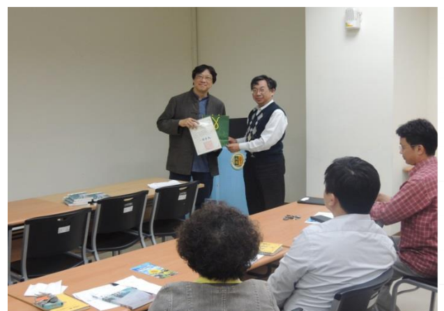
12月28日 頒發感謝狀、禮物