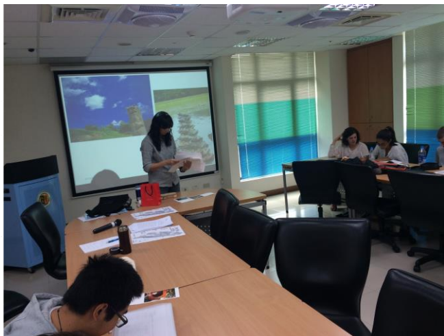
臺灣地理簡介專題演講