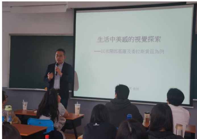
歷史文化與專題演講