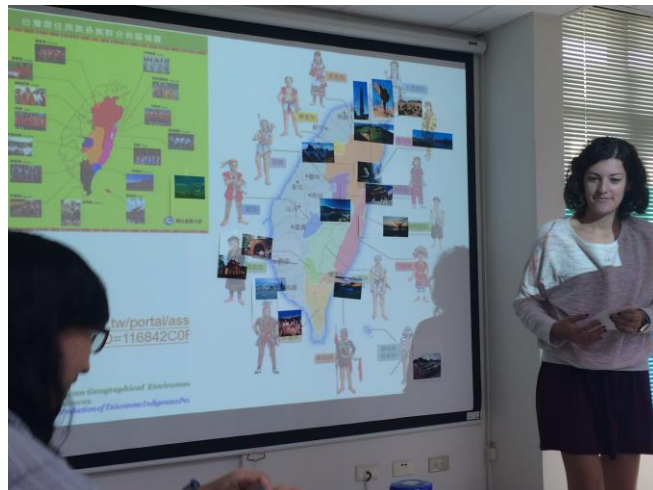
臺灣地理簡介專題演講