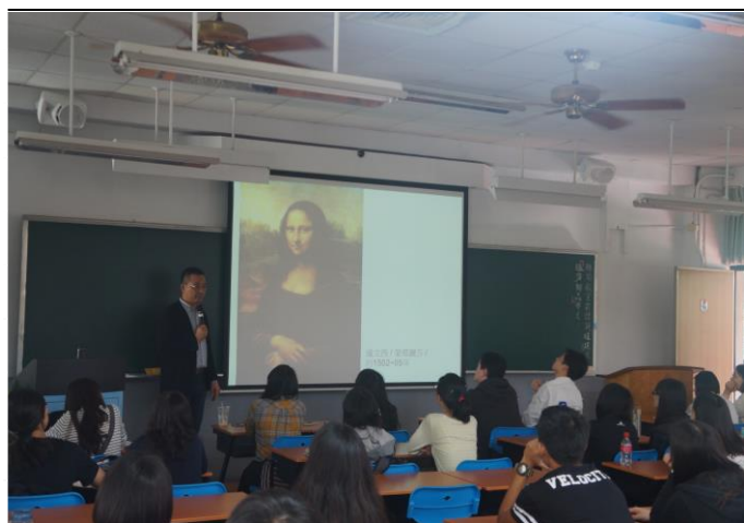
歷史文化與專題演講