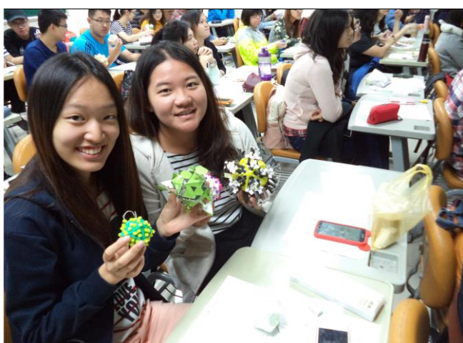
病毒、登革熱與治療專題演講