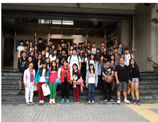
「性別與家事法」戶外教學—參觀法院