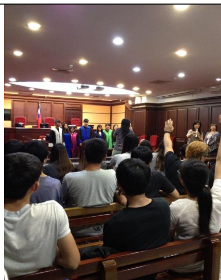
「性別與家事法」戶外教學—參觀法院