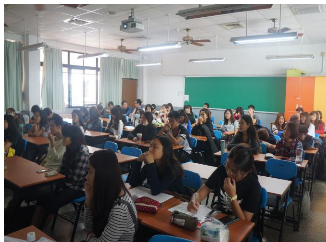
歷史文化與專題演講