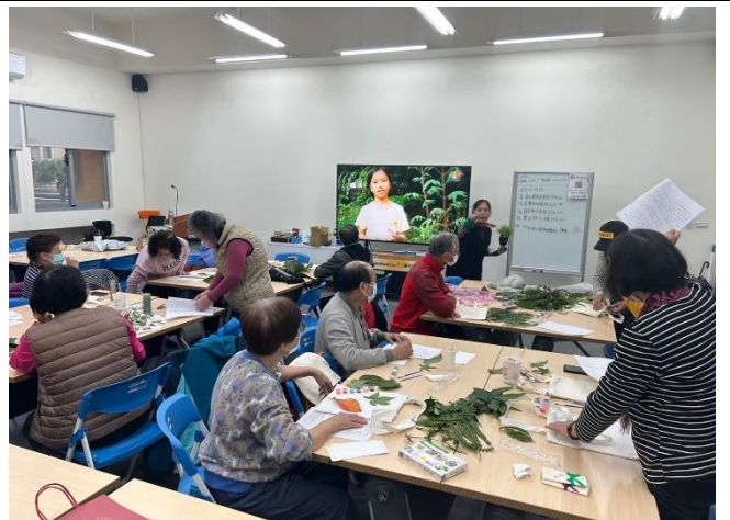
環保手作 DIY 課程