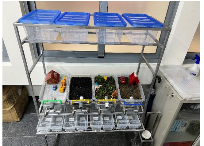
室內課程及模擬實驗